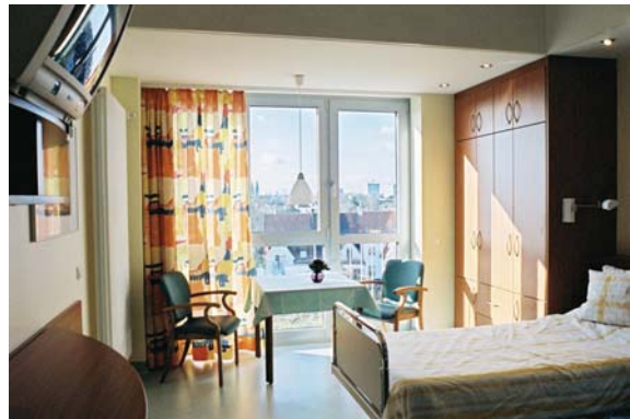
Patientenzimmer im St. Joseph-Stift

tologischer Einheit, Augenheilkunde, HNO-Heilkunde, Anästhesiologie und operative Intensivmedizin, Geriatrie, Geriatriischer Tagesklinik und Frührehabilitation. Vor drei Jahren wurde im SJS die Klinik für Naturheilverfahren, klassische Homöopathie und allgemeine Innere Medizin gegründet. Es bestehen ärztlich geleitete Institute für Radiologische Diagnostik und für Laboratoriumsmedizin. Computertomographie und Nuklearmedizin werden von einer in das Krankenhaus integrierten Fachpraxis angeboten. Zudem sind zwei Ärzthäuser, die ambulante Klinik am St. Joseph-Stift und das medicum bremen mit verschiedensten Fachrichtungen angegliedert. Ebenfalls auf dem Gelände des Krankenhauses angesiedelt hat sich die Bremer Caritas mit ihrem Sitz und einem Seniorenwohnheim. Seit 2005 steht eine Tiefgarage zur Verfügung.