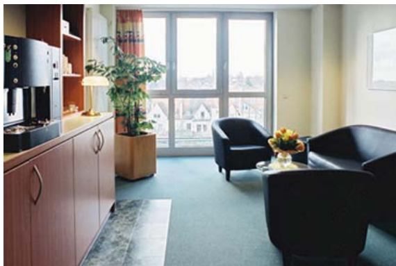
Aufenthaltsraum auf einer Station für Patienten und Besucher

Das Krankenhaus St. Joseph-Stift ist seit 1986 Akademisches Lehrkrankenhaus der Universität Göttingen und verfügt über eine hauseigene medizinische Fachbibliothek. Außerdem sind dem Haus eine Elternschule sowie ein Schulungszentrum für Patienten und Therapeuten angeschlossen. Krankenhauseelsorger beider Konfessionen und Psychologen stehen den Patienten zur Seite. Darüber hinaus wird der Sozialdienst des Hauses jederzeit unterstützend tätig. Wie in jedem modernen Krankenhaus zählen zu den Einrichtungen für Patienten und Besucher ein Café, Restaurant, Blumenladen, Friseur und ein Kiosk für kleine Einkäufe. Seit mehr als einem Vierteljahrhundert sind im Krankenhaus St. Joseph-Stift die Mitarbeiter der Christlichen Krankenhaushilfe (CKH), sowie die Damen des Bücherdienstes mit regelmäßigem Literaturangebot ehrenamtlich auf den Stationen und im Lotsendienst tätig.