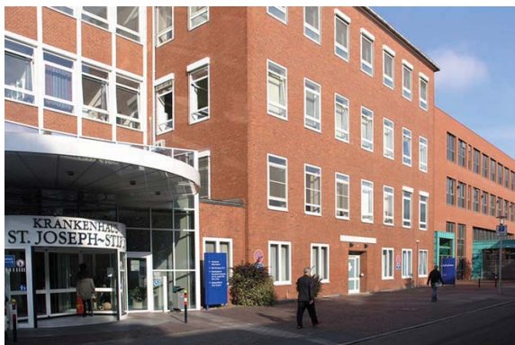
Eingangsbereich des Krankenhauses heute

Als die ständig steigende Zahl der um Aufnahme Bittenden die begrenzten Kapazitäten des Hauses in der Mittelstraße zu sprengen drohten, beschloss der Verein den Bau eines Krankenhauses für das St. Joseph-Stift. 1881 konnte an der Schwachhauser Chaussee die Einrichtung mit 60 Betten bezogen werden. Großzügige Spenden, überwiegend von Bremer Kaufleuten, auch aus nichtkatholischen Portmonees, hatten dies ermöglicht, wie auch die späteren An- und Umbauten sowie Modernisierungen des Krankenhauses.